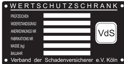
Typenschild VdS Tresore

Zusätzliche Tresorschlüssel werden aus Sicherheitsgründen nur nach Vorlage des Originalschlüssels angefertigt.